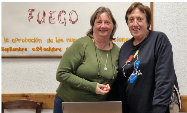
Secretaría y auxiliar