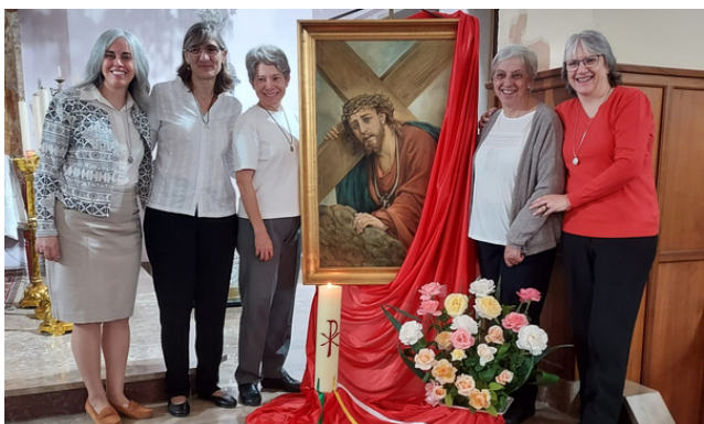
Comisión Constituciones y Directorio