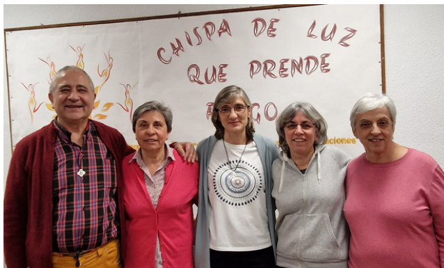
Comisión Coordinadora del Capítulo