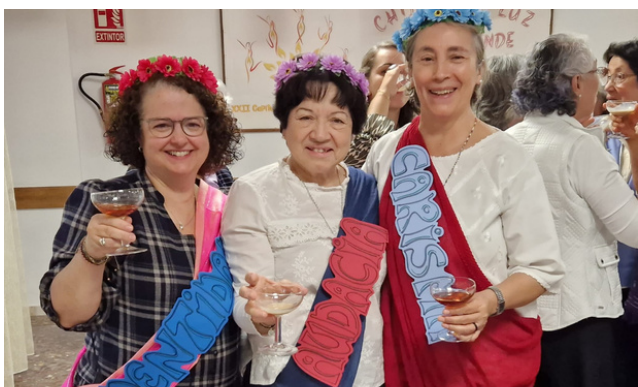
Equipo de Animación