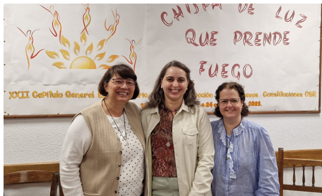
Equipo de Comunicación